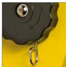
Nastavenie napätia pružiny model YFS-01/02

Pneumatické náradie, montážne náradie, striekacie pištole, nítovacie náradie, viacsobné ťahovanie, brúsne a leštiace náradie.