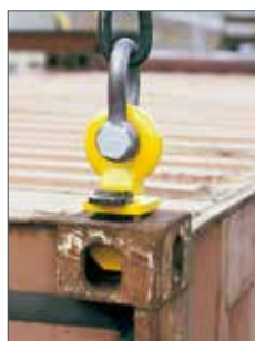
Kontajnerové závesné oko model TCO